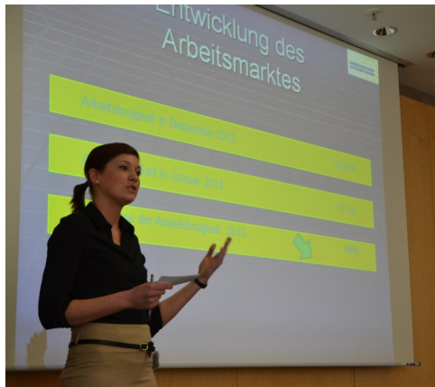
Projektpräsentation in der EZB in Frankfurt am Main

Weitere Informationen zu diesem Bildungsgang können Sie auf der Homepage unter http://www.bbs-melle.de/c/cms/front_content.php?idart=227 finden.