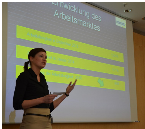
Projektpräsentation in der EZB in Frankfurt am Main

Weitere Informationen zu diesem Bildungsgang können Sie auf der Homepage unter http://www.bbs-melle.de/c/cms/front_content.php?idart=227 finden.